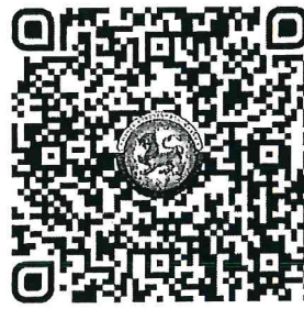
QR Code ๒ ตรวจสอบจำนวนผู้ชำระค่าลงทะเบียนแต่ละรุ่น