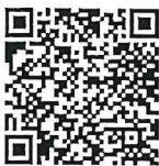
รายชื่อ รุ่นที่ ๖