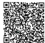
แบบฟอร์มจองห้องพัก